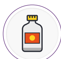
Envases y empaques de plaguicidas